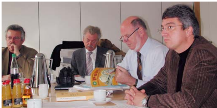
GdP im Gespräch mit dem AK Innen der SPD-Landtagsfraktion

Problemfeld bleibt die Personalstärke. 250 Neueinstellungen pro Jahr sind ein Mindestansatz. Ziel der GdP ist eine Stärke von 10000 Polizistinnen und Polizisten im Land. Dass mittelfristig mehr Personal in den Hundertschaften, Schichten und Kommissariaten zur Verfügung stehen wird, geht zu einem kleineren Teil auf die erhöhten Einstellungen zurück. Der größere Effekt kommt aus der verlängerten Lebensarbeitszeit. Das ist keine Lösung für die Personalprobleme. Die GdP sagt klipp und klar: § 208 LBG ist zu revidieren.