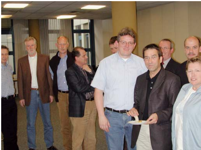
GdP-Stammtisch beim LKA – Auch für das leibliche Wohl war gut gesorgt

Preußinger und seinen Abteilungsleitern ein weiteres Fachgespräch. Im Vordergrund des Erfahrungsaustausches standen