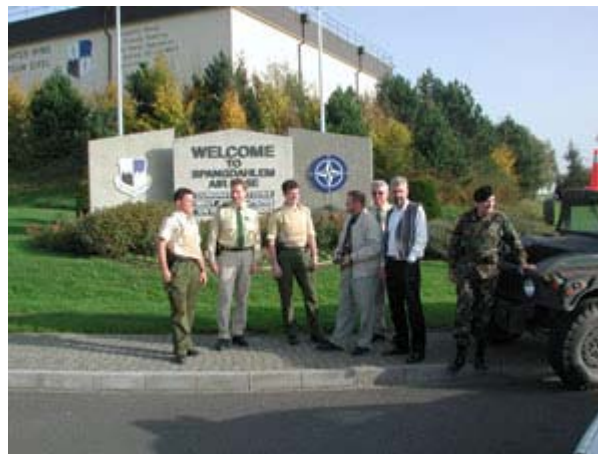
Zusätzliche Belastung durch den Schutz der Air-Base

Eine aus Personaleinsparungsgründen eingeführte Flexibilisierung