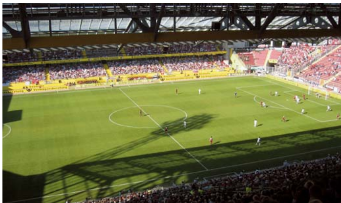
Fritz-Walter-Stadion in Kaiserslautern, Austragungsort WM 2006

seiner Position abgerückt, den Weg in den Westen des Landes nur noch für jüngere Polizistinnen und Polizisten offen zu halten. Aber 60% Anteil an Versetzungen für die Jüngeren will er schon sehen. Die GdP hält dagegen: Die Balance zwischen den Gruppen müsse gewahrt bleiben.