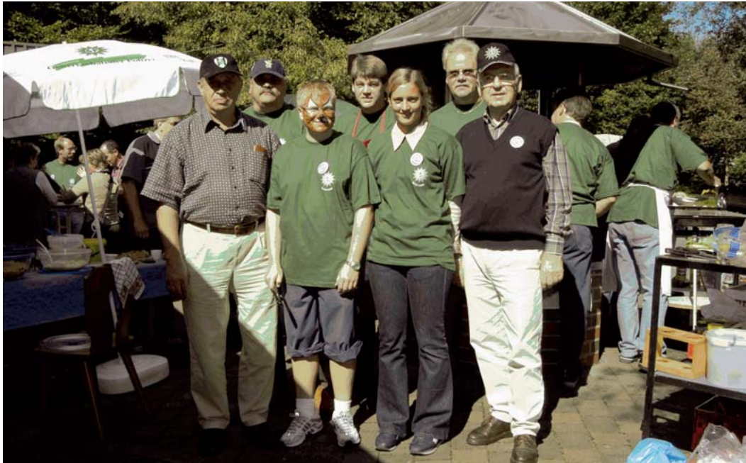
Tolles Wetter und gute Laune: Alt und Jung amüsierten sich gemeinsam bei der All-Inclusive-Party der GdP in Marienhausen