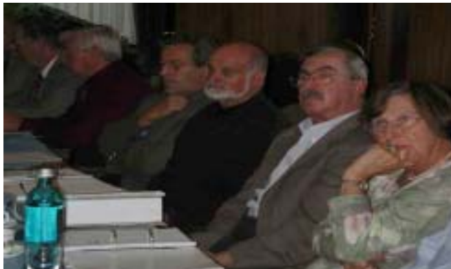
Aufmerksame Delegierte bei der Seniorenkonferenz