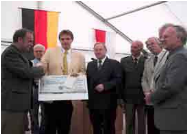
Scheckübergabe in Koblenz durch Helmut Knerr an Lothar Funk. Bildmitte: Innenminister Walter Zuber

Die Kolleginnen und Kollegen erhalten mit beiden neuen Wirkungsstätten aus Sicht der GdP sehr funktionale Polizeidienststellen. Nach langjährigen GdP-Forderungen für die Kolleginnen und Kollegen aber auch für die innere Sicherheit und