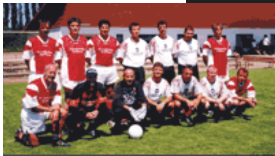
Die Teams der KD Mainz und der PI Frankenthal

Oberliga, von Freizeitkickern bis Ü40-Spielern, aufeinander und zeigten bei hohen Temperaturen guten Fußball und faire Spiele. Die Spiele