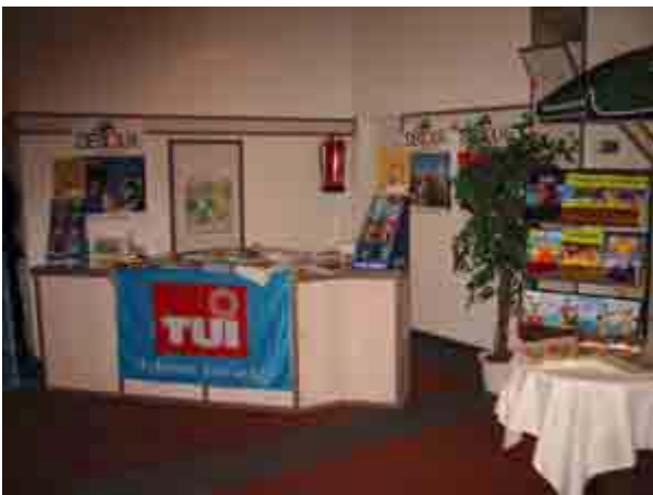
Service vor Ort: Das PSW-Reisebüro