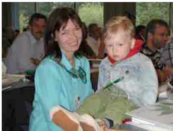
Die GdP diskutiert die Zukunft der Polizei, der Nachwuchs hört aufmerksam zu

Organisationsreform von 1993 hat einen gravierenden Schönheitsfehler. Die Polizei bezahlt bei der Verkehrsüberwachung das Personal