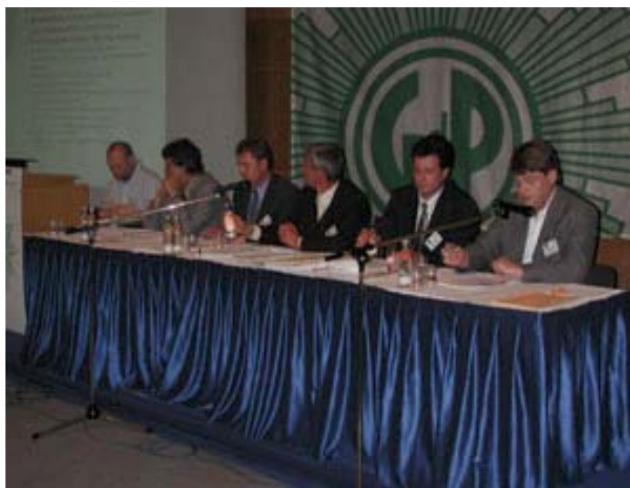
Das Programm Polizei 2014 wird vorgestellt.

Mit der Reform des Polizei- und Ordnungsbehördengesetzes der letzten Jahre wurden umfassend Zu-