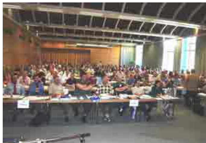
Im Saal ...

tig empfunden wird. Dennoch dürfen wir in unseren Bemühungen bei der Jugendverkehrsschule, der