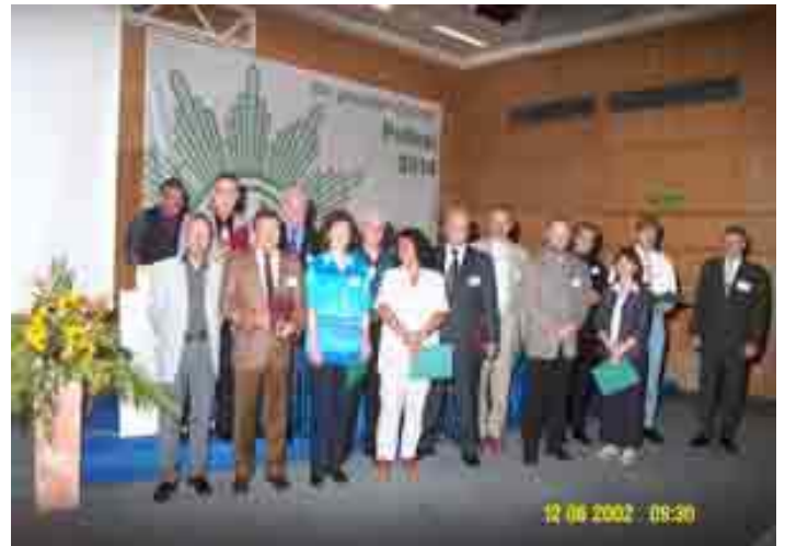
Verdiente Funktionäre ausgezeichnet