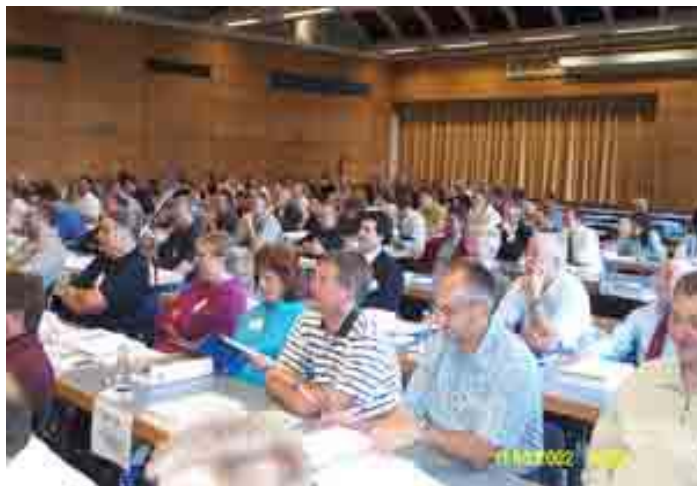
... interessierte Zuhörer

innen und Bürger, wenn sie Hilfe brauchen. Die an sich zuständigen Behörden haben nicht ausreichend Vollzugskräfte eingestellt. Die GdP fordert, die Bestellung von Vollzugskräften verpflichtend vorzuschreiben.