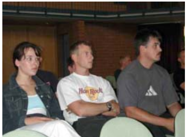
Aufmerksame Zuhörer beim Info-Treff der JUNGEN GRUPPE in Mainz

Absolventen auf dieses Reformangebot im Bereich der Ausbildung fiel zwiespältig aus. Während bei einem Teil der Kolleginnen und Kollegen durchaus Zustimmung geäußert wurde – Stichwort: „Mir reicht für den Aufstieg ein Lehrgang von 9 – 12 Monaten. Auf ein Diplom, das ohnehin nur im Polizeibereich eine Rolle spielt, kann ich verzichten“ – gingen andere Betroffene klar auf Gegenkurs. „Mir ist bei der Einstellung zugesagt worden, die FH der Polizei absolvieren zu können. Das Laufbahnrecht der Polizei hält mich ausdrücklich dazu an. Jetzt will ich auch auf den Hahn gehen“, machte ein Kollege sehr engagiert seine Position deutlich. Da die politischen Entscheidungen für die Ausbildungsreform bereits gefallen sind und die Detailplanungen laufen, wird dieser Anspruch als Angebot für die gesamte Gruppe nicht zu verwirklichen sein. „Das will ich nicht hinnehmen, dann werde ich