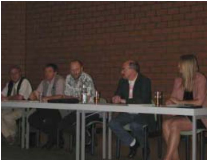
Berufsperspektiven diskutiert mit Experten und GdP-Vertretern

Fazit der Veranstaltungen: Die geplante Ausbildungsreform findet bei vielen, aber nicht bei allen Kolleginnen und Kollegen der DoQuA Akzeptanz. Das Laufbahnrecht muss so schnell wie möglich korrigiert werden, damit der Zugang zum gehobenen Polizeidienst, die Beförderung und die Lebenszeiteinstellung nicht auf Jahre verzögert werden. Zu regeln ist ebenso die Bestellung als Hilfsbeamter der Staatsanwaltschaft. Die JUNGE GRUPPE und der GdP-Landesvorstand liegen bei diesen Themen mit ihren Forderungen genau richtig. Die Info-Treffs mit den Absolventen der