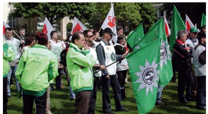
In Mainz folgten rund 250 Kolleginnen und Kollegen dem Aufruf zum Warnstreik. Sie fordern für den Bereich des Landes den Abschluss des Tarifvertrages für den öffentlichen Dienst und protestierten gegen das Strukturreformgesetz der Bundesregierung.