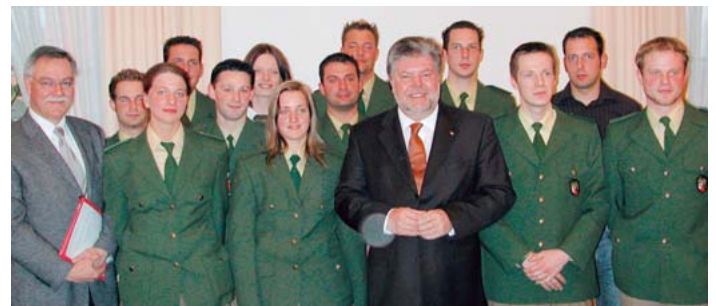
Mitglieder der JAV im März bei Ministerpräsident Kurt Beck und Innenminister Karl Peter Bruch