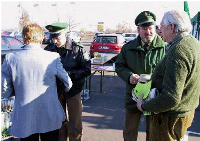
Positive Resonanz in Wittlich und . . .

So und ähnlich berichteten die Tageszeitungen von den Aktionen der Landes-GdP. Die Kreisgruppen waren aufgefordert, in