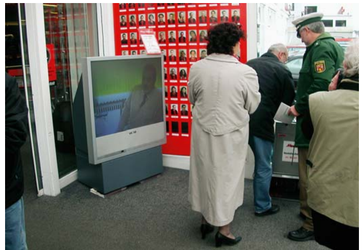
. . . in Kaiserslautern

Alles in allem kann gesagt werden, dass die Aktion ein voller Erfolg war. Es wäre sicherlich interessant gewesen, wenn die Landtagsabgeordneten, die demnächst über die Änderung der Lebensarbeitszeit bei der Polizei