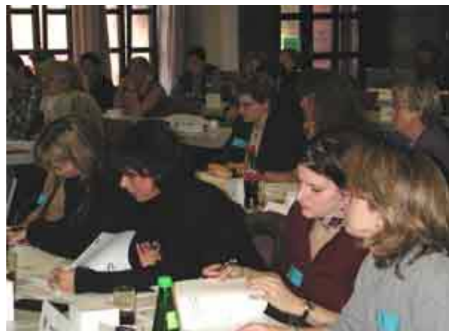
Sie setzen die Leitlinien für die Frauenarbeit der GdP: Delegierte der Landesfrauenkonferenz

Die GdP-Frauengruppe fordert einen Stellenpool, um in Fällen von Erziehungsurlaub direkt Personalerersatz bereit zu haben. Für Angestellte werden bessere berufliche Pers-