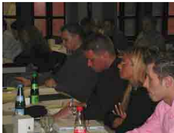
In der JUNGEN GRUPE der GdP aktiv: Delegierte der Landesjugendkonferenz

Beim Thema Schichtdienst blieb es auch nicht allein. Zur Debatte standen eine Reihe von Themen vom ASA bis zum Pfefferspray. Dort wo Verbesserungen gefordert