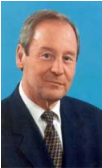
Innenminister Walter Zuber

Personalplanung und effektiver Personaleinsatz, Polizeipräsenz vor Ort und Ausbildungsreform – das sind die Themen, die in den letzten Monaten die Diskussion in der Polizei und in den politischen Fachkreisen geprägt haben. Die SPD-Fraktion hat zum Jahresbeginn eine neue Einstellungs- und Ausbildungskonzeption für die Polizei präsentiert. DEUTSCHE POLIZEI erörtert mit Innenminister Walter Zuber die Zukunftsplanungen.