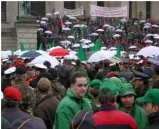
Schirm auf, GdP-Mütze auf den Kopf und Protest gegen Schilys Pläne

ben noch ein paar Mark für ein Bier über.