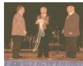
Sebastian in Aktion

Blues-Dixi. Mit einem lockeren Empfang ging der Festakt zu Ende,