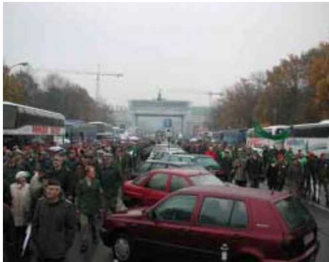
25.000 Polizisten und Soldaten beim Marsch durch das Brandenburger Tor

„Gendarmen von Rhein und Mosel marschieren auf Berlin los“. Vor 200 Jahren hätte diese Nachricht zur Order des Kaisers geführt, die „Revolte mit Militäreinsatz niederzuschlagen“. Es ging ohne Gewalt ab in Berlin: Am 26. November demonstrierten 25.000 Polizisten und Soldaten gegen die geplante Kürzung ihrer Pensionen, für mehr Personal und modernere Ausstattung.