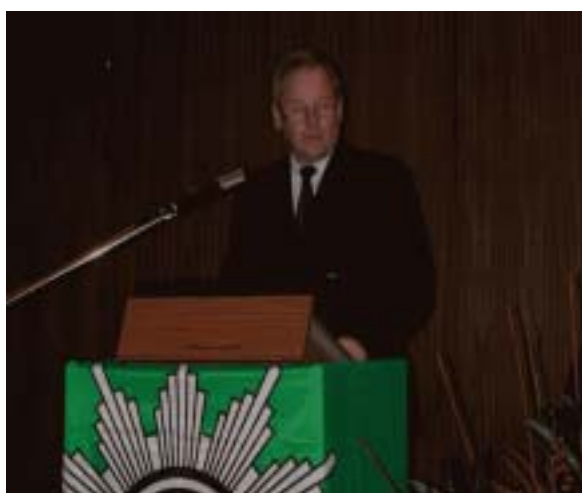
Innenminister Walter Zuber

Innenminister Walter Zuber hob in seiner Festansprache hervor, die GdP habe „mal im Konflikt; mal