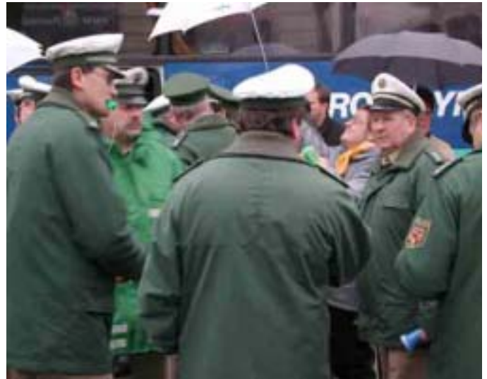
Kollegen aus der Westpfalz demonstrieren auf dem Gendarmenmarkt

ihre Interessen auf die Straße gegangen. Das Bild des Gendarmen-